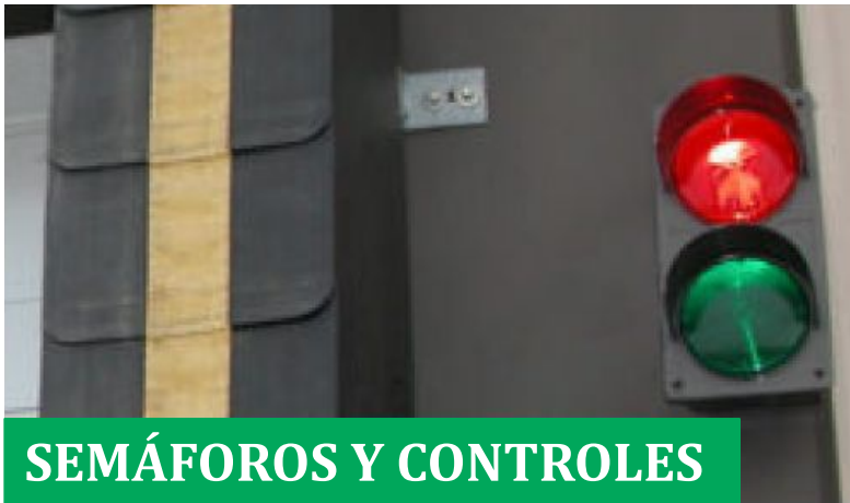
SEMÁFOROS Y CONTROLES