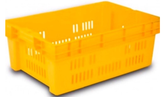
CAJA ZAMORA 22